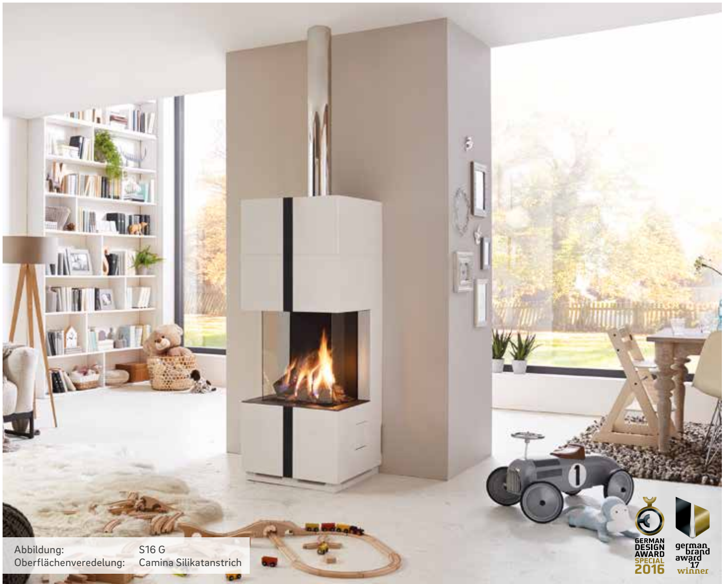
Abbildung: S16 G Oberflächenveredelung: Camina Silikatanstrich